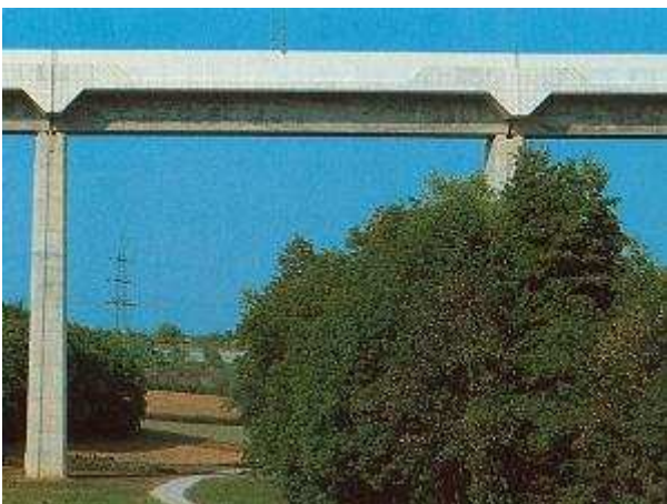
Auf einem Viadukt bei Markgröningen

Wir haben nachfolgend zwei Beispiele für Schallschutzwände zusammengestellt: