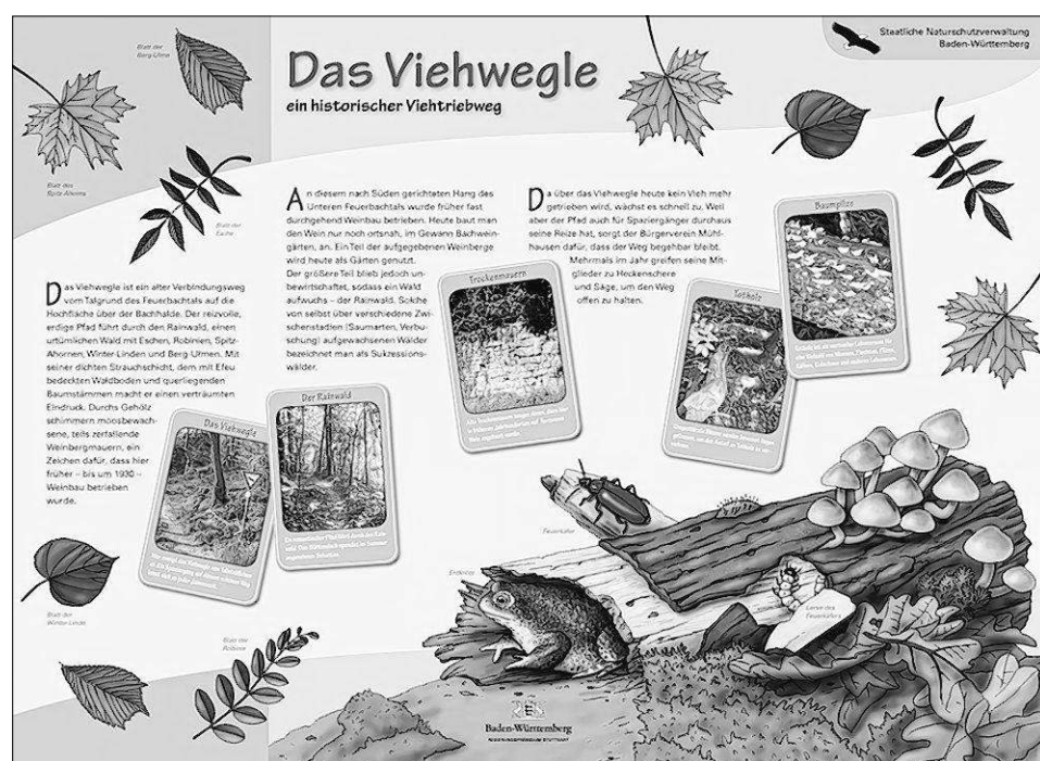
So sieht eine der 14 Tafeln aus, die Auskunft über das Naturschutzgebiet geben.

Regierungsvizepräsident Christian Schneider sagte bei der Eröffnung, dass man zeigen wolle, weshalb es wichtig sei, das Gebiet durch Verhaltensregeln besonders zu schützen. Darüberhinaus lobte er das Projekt als „mustergültiges Beispiel für bürgerschaftliches Engagement verschiedener Gruppen“ mit dem Regierungspräsi-