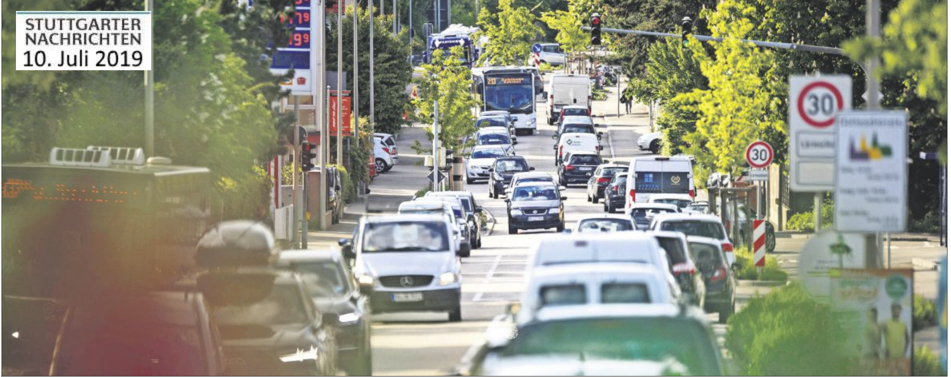
In Waiblingen-Hegnach könnte der Verkehr durch einen Nordostring weniger werden.